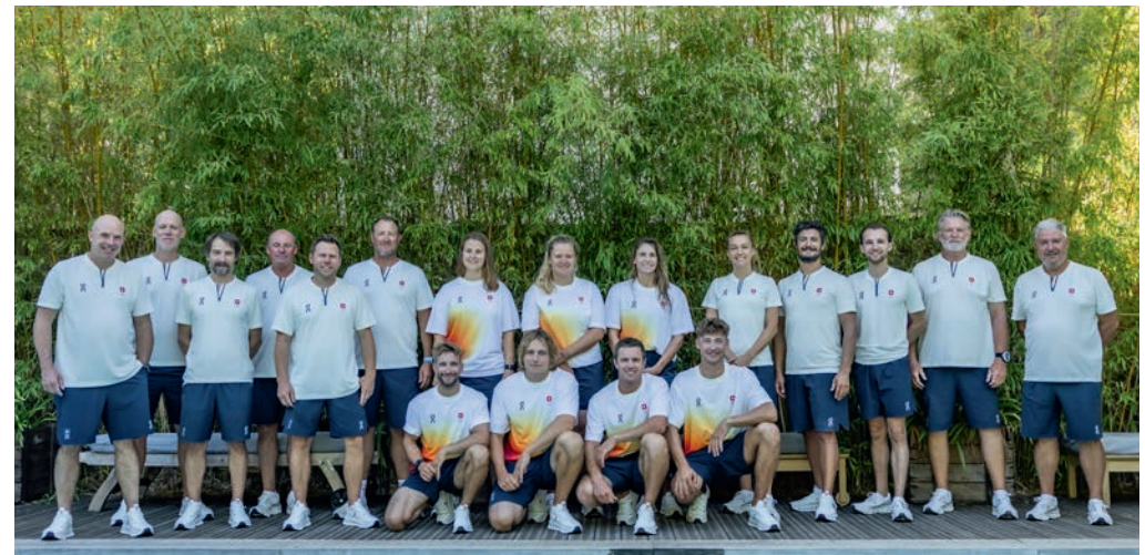
Das Swiss Sailing Team an den Olympischen Spielen 2024.